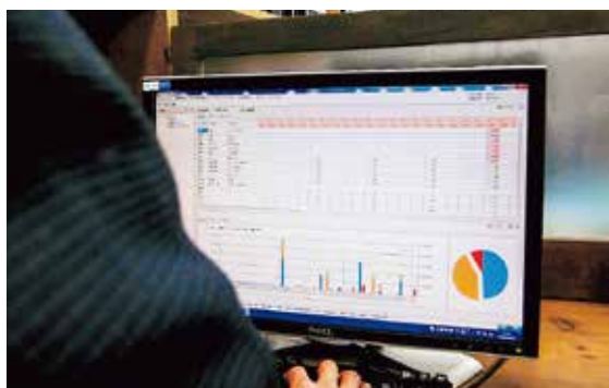
当社独自のシステムを使い修繕状況を分析