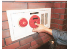
▲火災報知設備点検