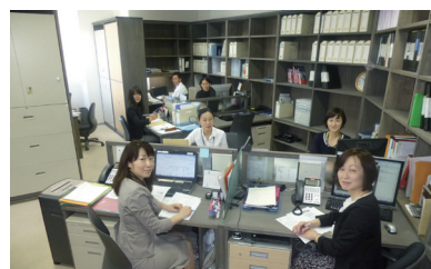
3階（売買コンサル事業部、総務経理部）