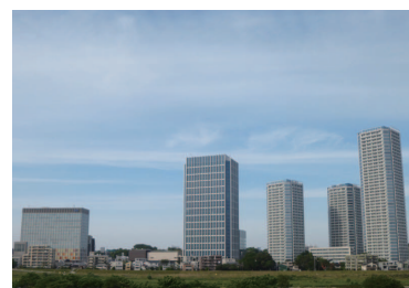
多摩川から見た二子玉川の風景