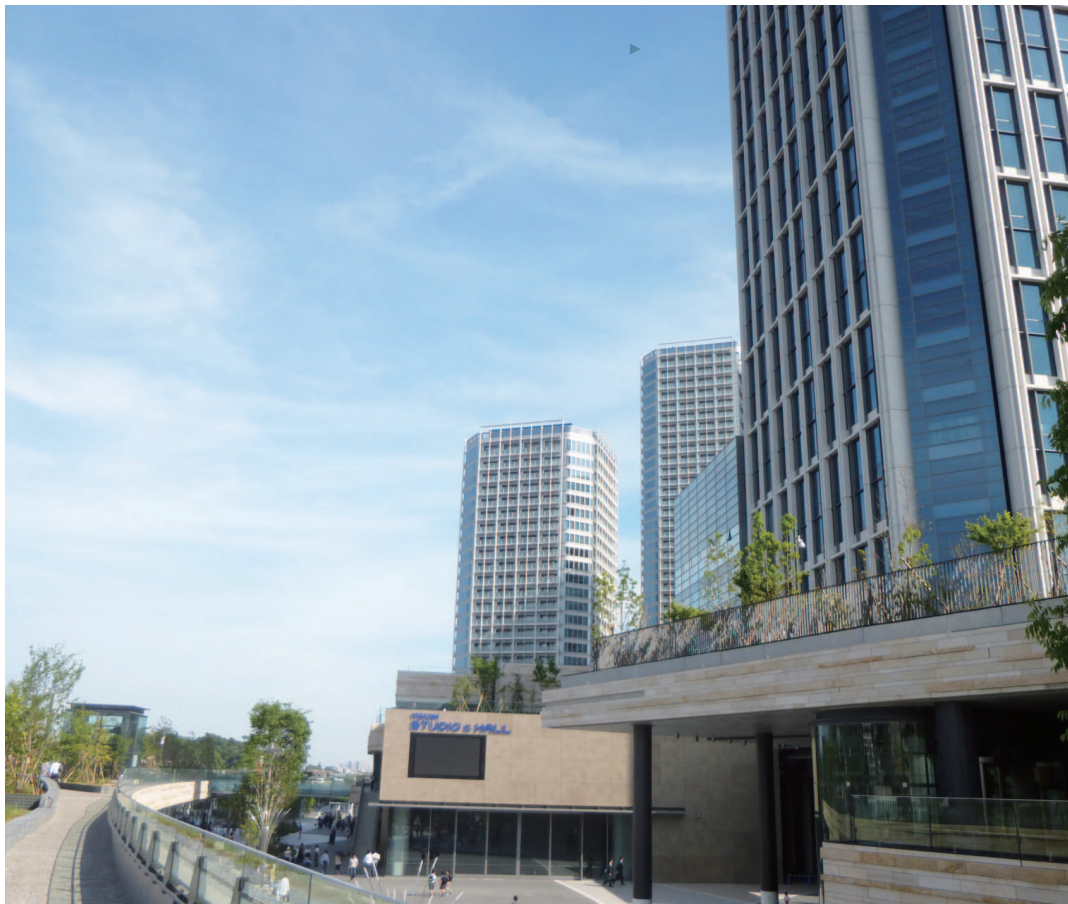
右側が「楽天」本社が今年8月に移転予定の二子玉川ライズ・タワーオフィス