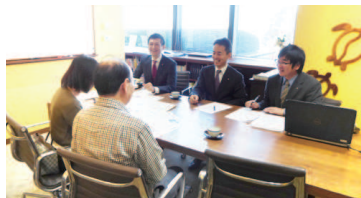
過去の相談会の様子