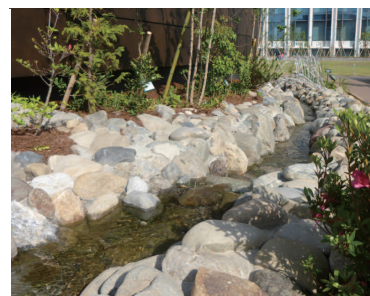
周囲の自然を意識した、緑・水のある屋上