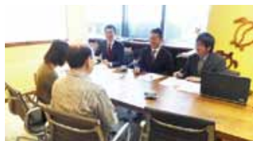
過去の相談会の様子