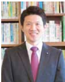
株式会社市萬 コンサルタント・雨漏り診断士 渡辺 著

経年劣化で外壁と雨水管のつなぎ目に隙間ができ、ここから侵入した雨水で天井に茶色い染みが発生。シーリングで隙間を埋め防水。