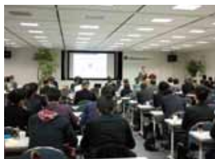
過去の勉強会の様子

突然の相続。その時になって慌てないよう「不動産保有者が知っておきたい“これからの相続対策”」について、勉強会を実施します。テーマ別に全4回。この機会に是非ご参加ください。