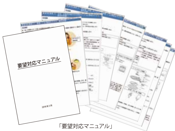
「要望対応マニュアル」

例えば「エアコンの不具合」には①メーカー、型番製造年の確認②症状の確認③症状に応じた対応が記されています。マニュアルの対応をすることで、その場で問題が解決することも。また、事前の状況確認をしっかりと行っていることで、修繕業者への指示も的確に行え、一度の来訪で修理完了となります。事前の確認をせず修繕業者をお願いすると、現場に行ってもその日に修理できず、改めてお伺いしなくてはならないことも。その間、入居者様にご迷惑をかけることになりかねません。 先日オナー様から修繕業者と当社の建築士が連携