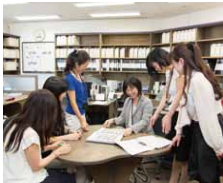
問合せに対応する女性スタッフ

賃貸管理をしていると入居者様から様々なお問合せが入ります。特に、古い物件を数多く管理している当社は多数の問い合わせを頂きます。それに対して、入居の際に独自の入居のしおりをお渡しし、設備の不具合の対応方法などをお伝えしたり、24時間サポートセンターと提携するなど、入居者様のトラブルに迅速に対応するようにしています。 もちろん、直接当社へお問合せをいただくこともあり、その対応は女性スタッフが行っていきます。誰もが同じレベルでの確かつ迅速に対応できるように、「要望マニュアル」を作成し専門的な知識がなくても、事前のヒアリングやアドバイザーが的確に行えるよう