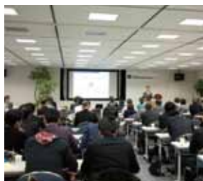
過去の勉強会の様子

昨年から今年にかけて4回に分けて開催し、好評を頂いた相続対策勉強会。その内容をギュッと凝縮してお届けします。突然の相続で慌てないよう、この機会に是非ご参加ください。