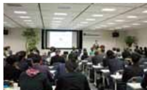
過去の勉強会の様子

好評をいただきました 全4回シリーズの相続対策勉強会をギュッと凝縮した総集編です。この機会にぜひご参加ください。