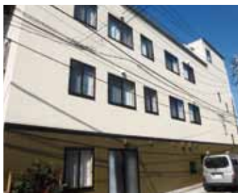
区の景観条例に基づいたシックな外観