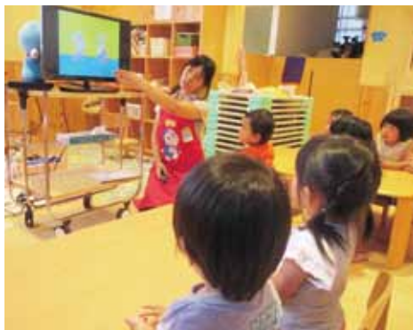
本件の事業者が経営する他の保育園

お客様への提案のポイントは3つ。 ①現在入居されているテナントの立退きについては、相手の事情や立場を考慮し、十分に時間をとる ②建物の解体前に幅広くテナント募集を行い、収支を確認してから建物を建築する ③建築費に対する賃料収入回りは12%以上とする。 ですが、条件に合うテナントは、なかなか見つかりませんでした。