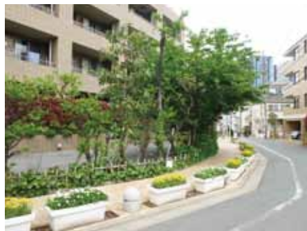
建物周辺をプランターの花で飾ることで、物件へのアプローチを演出しています

「枯れると汚く見える」「手入れが大変」と思われる方もいらっしゃるかもしれませんが、定期的に入れ替え、その時期に合った花や植栽を置くことで、そういった不安も解消できます。もちろん、正月には正月飾りを、クリスマスにはクリスマス飾りを、といったシーズンごとの演出もよいと思います。