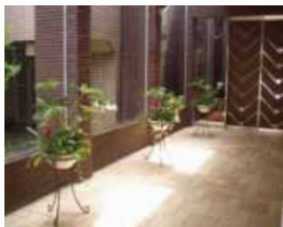
家に帰るたび、エントランスの植栽に心が癒されます