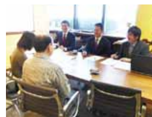
過去の相談会の様子