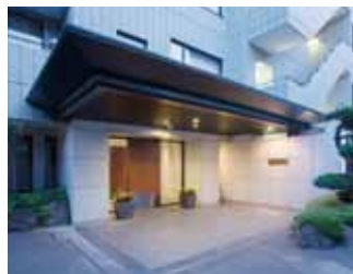
エントランスに植栽を置くことで華やかな印象に