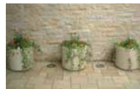
赤や黄色がグリーンに映える可愛い植栽