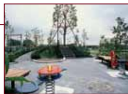
住まう人の憩いの場として街の中央には提供公園を設置