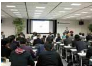
過去の勉強会の様子

好評をいただきました全4回シリーズの相続対策勉強会をギュッと凝縮した総集編です。この機会にぜひご参加ください。