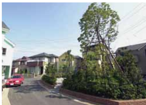
開発1年後の街並み。樹木も育ち、閑静な街並みに成長（フリーダムスクエア大和みどりが丘全22区画<丘の街>）

そこで、私どもは土地を開発し、分譲することを提案。ただの価値を上げるだけでなく、街づくりにも力を入れました。シンボルツリーのある公園を設け、道路には曲線を用いました。別荘地を参考にし、街路樹やレンガで街に統一感を持たせました。道路は今後の管理のことも考え、公道として扱ってもらえるように市との調整も行いました。こうして「フリーダムスクエ