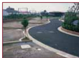
家に帰ってきたときにホッとできるよう、曲線を取り入れた道路計画。街路樹とレンガで街並みに統一感をもたせた