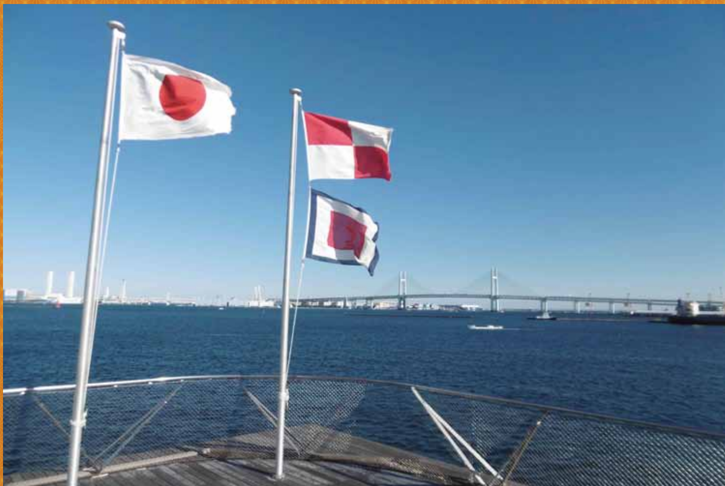
2つの国際信号旗は「ご安航を祈る」を表します。2017年も皆様の不動産の安定経営を祈願いたします。(横浜にて撮影：2016年12月 西島 昭)