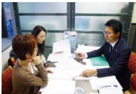
編集者を交えた打ち合わせの様子

借地人との権利調整に気苦労の絶えない地主さん、相続税の納税を目的の当たり前にして底地の換金