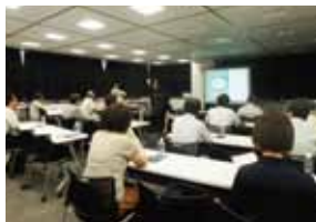
前回の勉強会の様子

好評につき、第2回開催。わかりにくい借地権を紐解いて、借地の悩みを解決する方法を具体的にお伝えします。