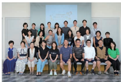
自分を表す普段のファッションがドレスコード。思い思いのファッションで集まりました。

去る8月29日、「コミュニケーション」をテーマに、25期キックオフを開催しました。良好なコミュニケーションは業績アップにもつながります。キックオフ後のイベントは全スタッフ並びにパートナースタッフも集まり、絆を深めることができました。今後の市萬にご期待ください。